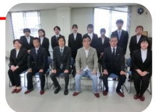
理事長と令和5年度 新規採用職員

※ お問い合わせは、豊橋市福祉事業会 法人本部（事務局）まで 愛知県豊橋市高師町字北原1番地104